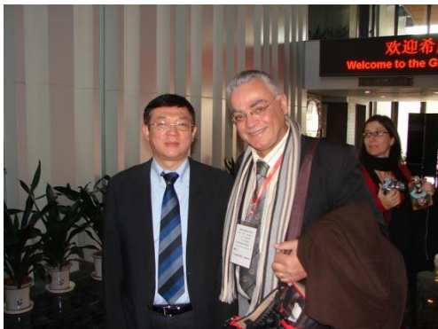
Confucius Institute, Beijing, With Vice President of Han Ban Organization, 2010