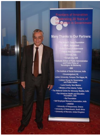
Harvard University, Ash Institute, J.F. Kennedy School of Government Conference of the Global Innovators in governance , Boston, 2008