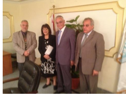
with Dr. Laila, Minister for Environment of Egypt, 2013