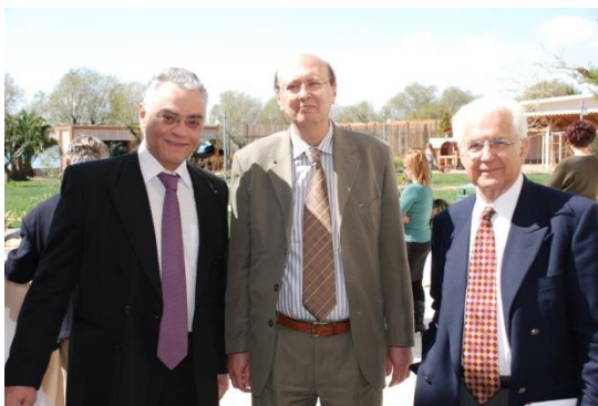
Καλαμάτα 2008 Με τον Πρόεδρο ΔΕ Πανεπιστημίου