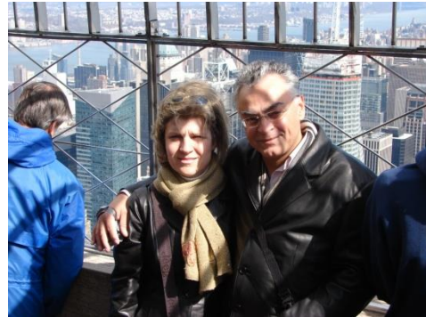
New York, Empire State Building, 2008