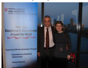
Harvard, Ash Institute, Harvard Conference of the Global Innovators in governance , 2008