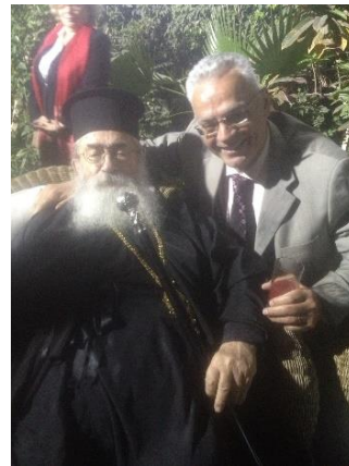
Με τον Αρχιεπίσκοπο Σινά κ.κ. Δαμιανό