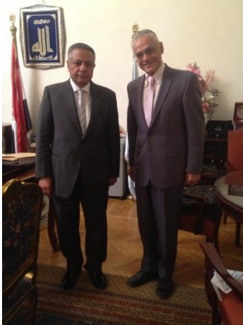
with Mahmoud Abo El Nasr, Minister of Education of Egypt, 2013