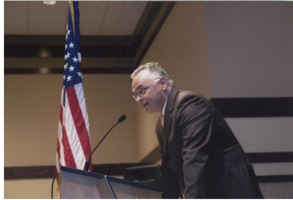
Chicago, Speech in the Conference American Philhellenes Society 1810-40 “American Philhellenes and their contributions to the Greek War of Independence”, 2009