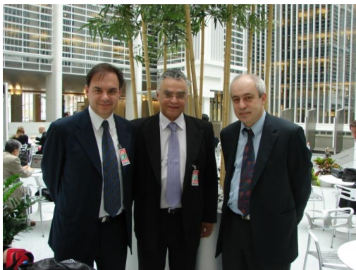
Washington, World Bank, 2008